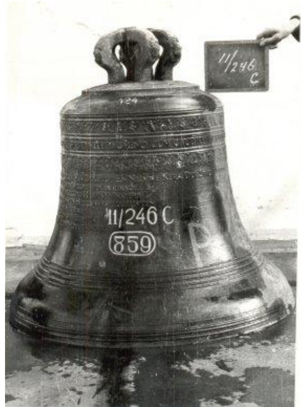
Servite, De Grave 1719 in 1808 verkocht naar Zoeterwoude gefotografeerd na uitneming in 1943