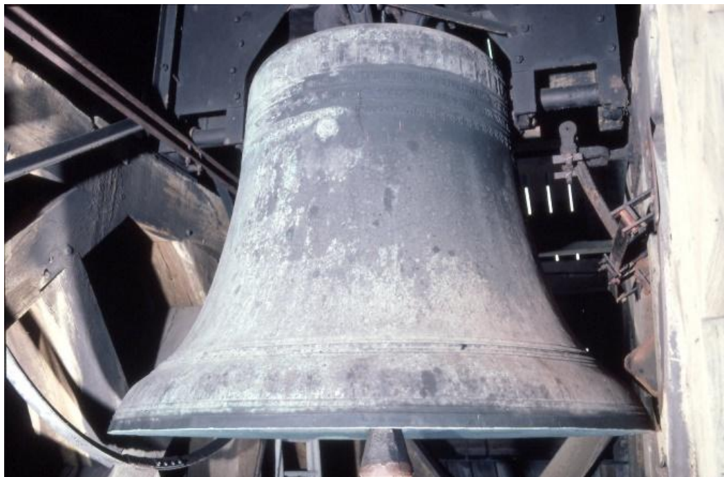
Trinitas of Bourdon, Van Trier 1570

Het geluid van de Trinitas moet tot in Brielle te horen zijn geweest. De klok bestaat nog steeds en was tot voor kort de grootste luidklok van Nederland. Bij de Delftse bevolking is deze klok bekend als de 'Bourdon'.