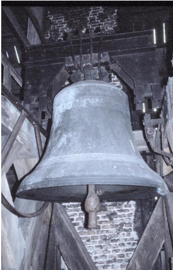
Laudate, De Grave 1719 gefotografeerd in de Oude Kerk