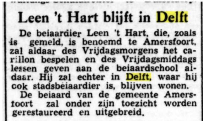
De Tijd, 3 maart 1953