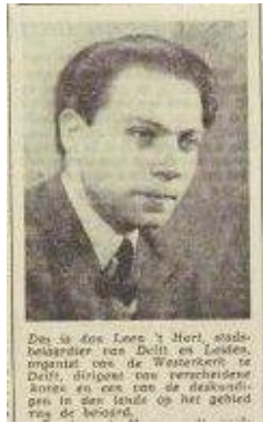
Dagblad voor Amersfoort 27 februari 1953

De benoeming in Amersfoort was voor 't Hart een reden om de aanstelling in Dordrecht, waar hij vrijdags speelde, op te zeggen. Maar met nadruk vermeldt een persbericht uit die dagen dat hij in Delft zou blijven wonen en werken.