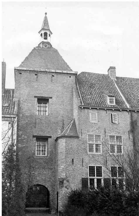
De Plompetoren [ook wel Dieventoren genoemd] in de Muurhuizen van Amersfoort