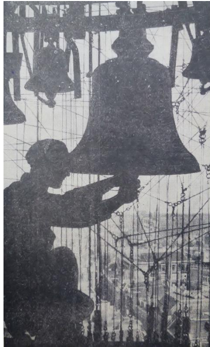
Leen 't Hart bij het klokkenspel van Delft Foto bij het artikel van Enkelaar

Om Leen 't Hart te introduceren bij de Amersfoortse burgerij reisde de Amersfoortse journalist Henk Enkelaar naar Delft voor een paginagroot en fraai geïllustreerd interview met de 'maestro'.