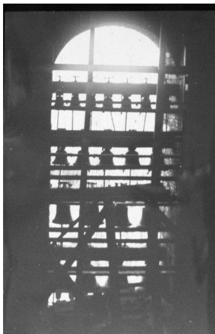
Het Brielse klokkenspel hing van 1660 tot 1943 in het galmgat boven het kerkdak