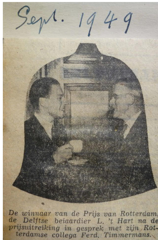
Knipsel uit het plakboek van Cor Don

De pers was van mening dat de Rotterdamse Beiaard Commissie uitmuntend werk had verricht met dit volkomen geslaagde carillonconcert. Zij heeft daarbij getoond ook metterdaad te streven de achterstand aan goede Nederlandse werken voor torenmuziek in te halen door opdrachten aan componisten te verstrekken. Over de nieuwe beiaard van Petit en Fritsen werd niet anders dan in lovende woorden gesproken. Met het Mechelse klavier was het mogelijk uiterst gevoelige klanknuanceringen te geven. Dit gamma van krachten van pianissimo tot zingend forte zou de talrijke toehoorders in de stille hof van het Raadhuis ongetwijfeld een gevoel van grote voldoening voor dit fraaie concert geven.