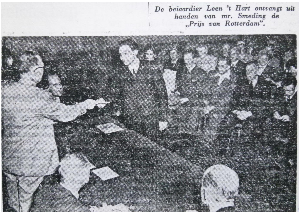
Knipsel uit het plakboek van Leen 't Hart

Het maximum aantal te behalen punten bedroeg 800.