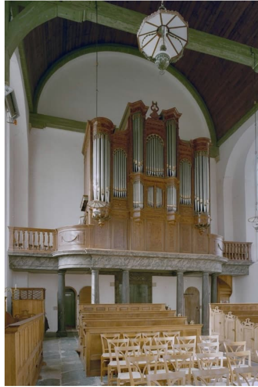
Het orgel te Midden Beemster