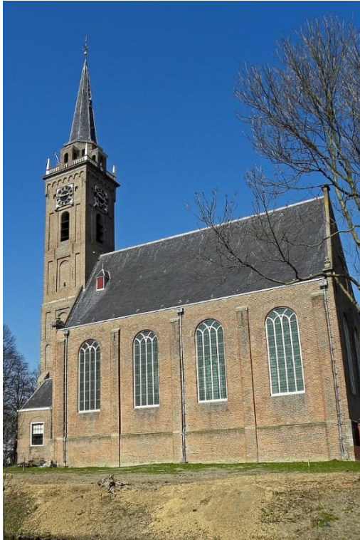
NH kerk te Midden Beemster - wikipedia