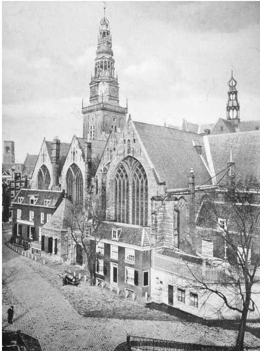
De Oude Kerk in Amsterdam - Loosjes 1916

Créman informeel spelen op de Oude Kerk. Later in de jaren twintig wordt hij zelfs genoemd als adjunct-klokkenist op de Oude Kerk. 43