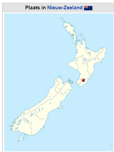
Locatie pianoverhuizers

Nickname(s): Windy Wellington, Wellywood Motto(s): Suprema a Situ [2] English: Supreme by position