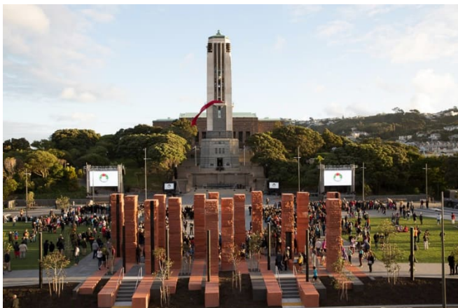
De klokketoren van Wellington – Nieuw Zeeland - wiki