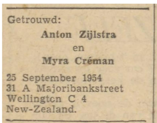
Huwelijksbericht in de POZC van 25 september 1954

Maria (Myra) Créman was in 1926 in Zwolle geboren en gedoopt. 2 In 1954 emigreerde zij naar Nieuw Zeeland, haar verloofde achterna. Haar uitschrijving uit het Zwolse bevolkingsregister viel in de periode van 13 tot 19 februari 1954. 3 Zeven maanden daarna trouwde Myra in Wellington [NZ] met Anton Zijlstra. 4