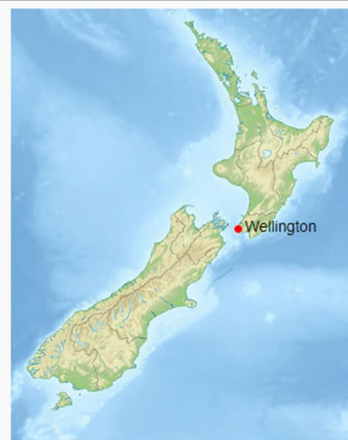
Location in New Zealand & Pacific Ocean Locatie hoofdstad Wellington

Nickname(s): Windy Wellington, Wellywood Motto(s): Suprema a Situ [2] English: Supreme by position