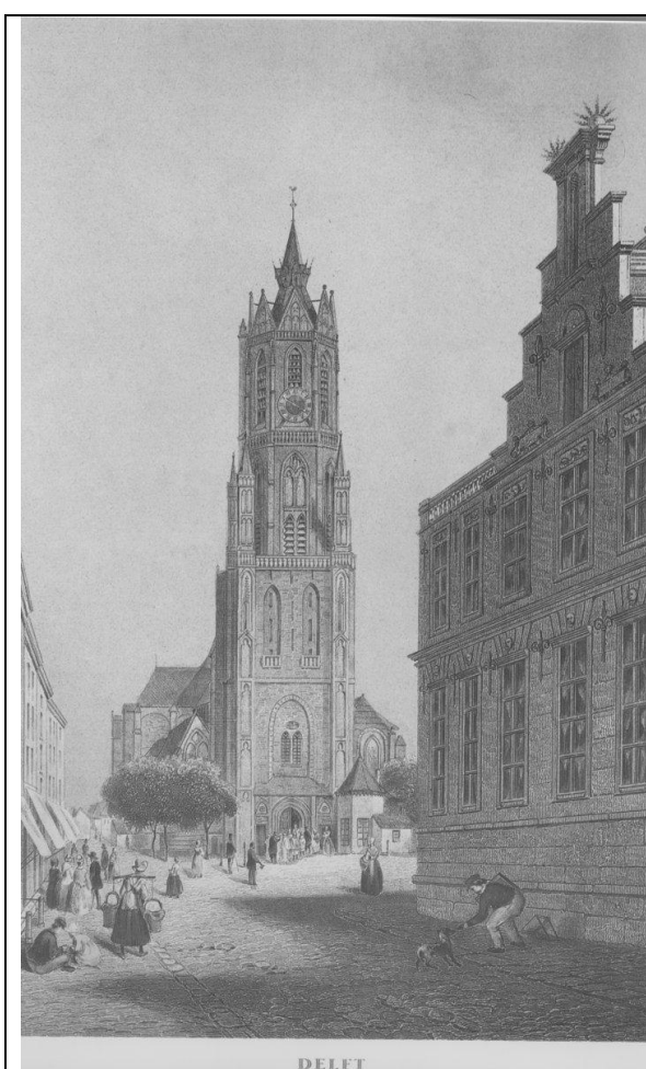
Nieuwe Kerk, 19e eeuw met oude spits

De grote stadsbrand van 1536 ontstond, naar men aanneemt, door blikseminslag in deze toren. Na enkele noodvoorzieningen aan de kerk herstelde men de toren. Reeds in 1537 was de spits vernieuwd. Deze spits werd in 1872 opnieuw door brand verwoest. toen werd de spits aangebracht die nu nog steeds de toren van de Nieuwe Kerk bekroont.