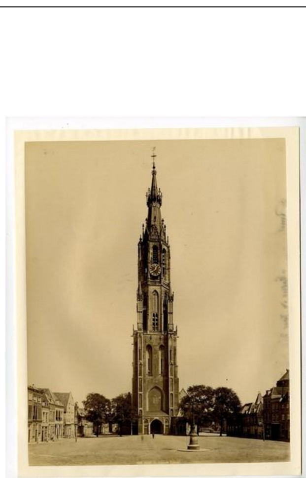
Nieuwe Kerk, 19e eeuw met nieuwe spits