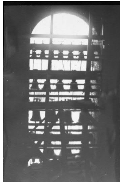
Sinds 1660 hingen de Hemony-klokken in Brielle in de Oostelijke torenopening.