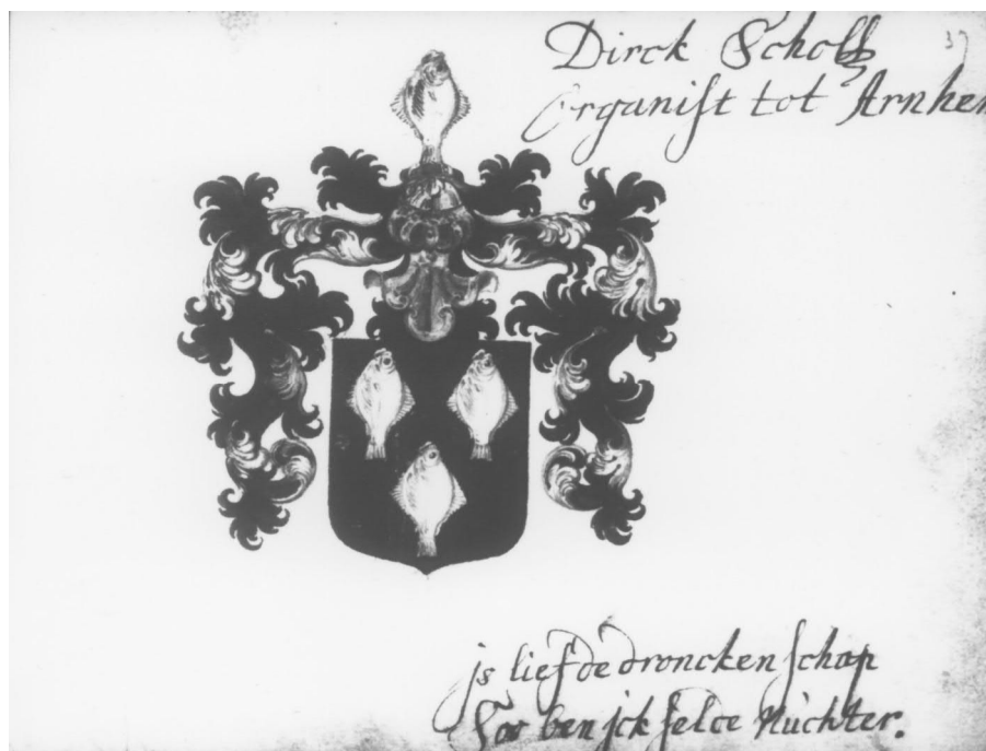
Bladzijde uit het Ledenboek van het Arnhemse muziekgezelschap Cecilia