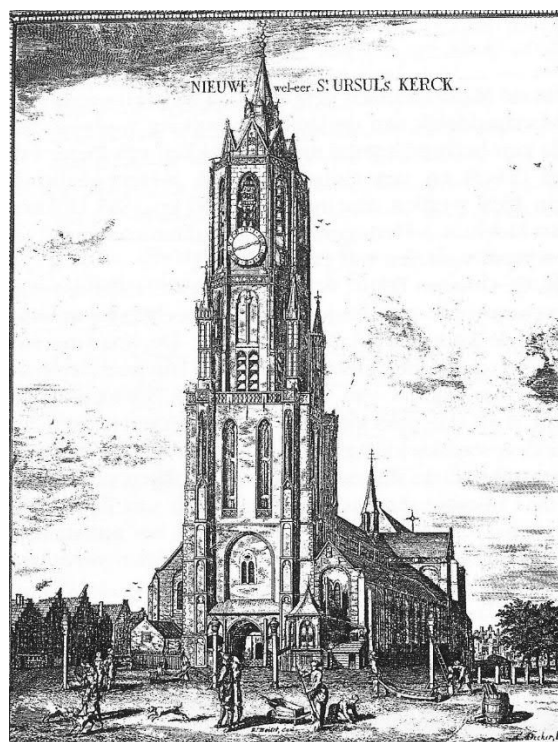
Delft, Nieuwe Kerk