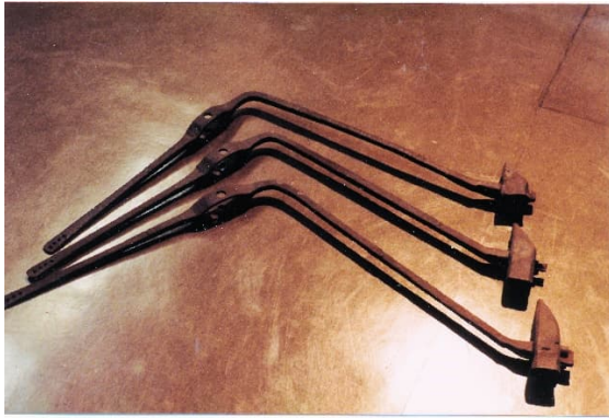
Brielle – speelhamers uit 1660