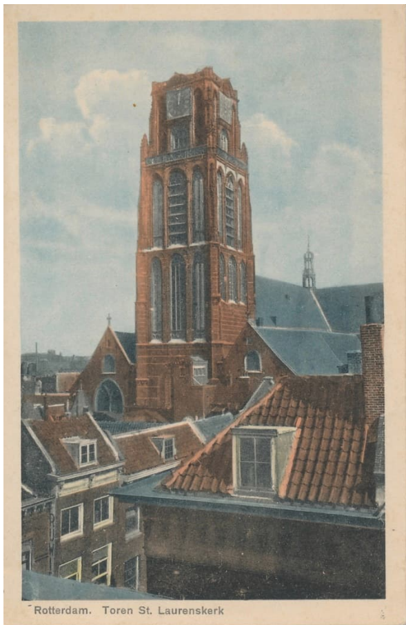
Laurenstoren en omgeving ca 1920