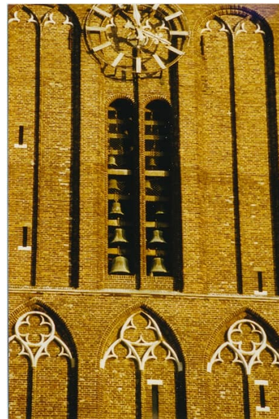
St Jan Schiedam met klokkenspel