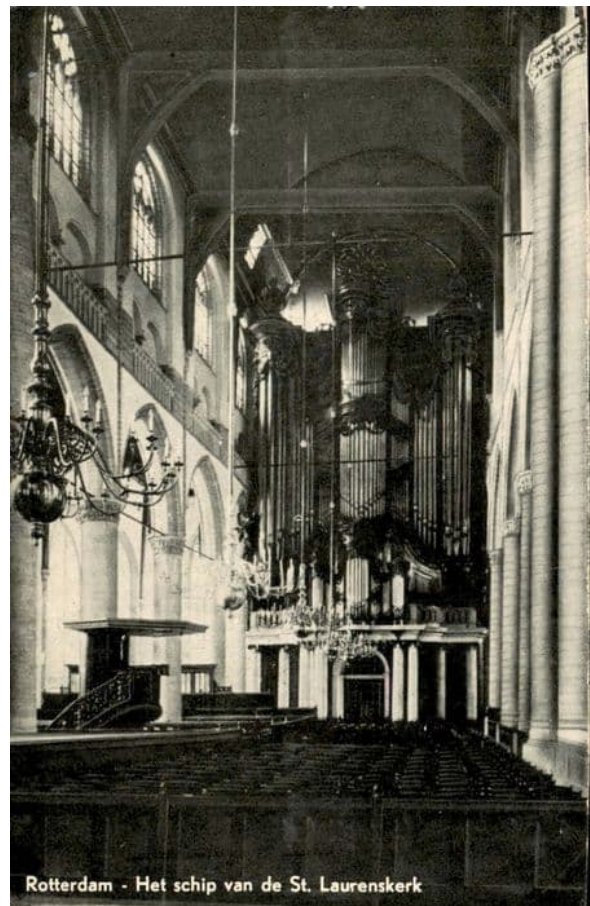
Laurenkerk interieur met orgel ca 1920