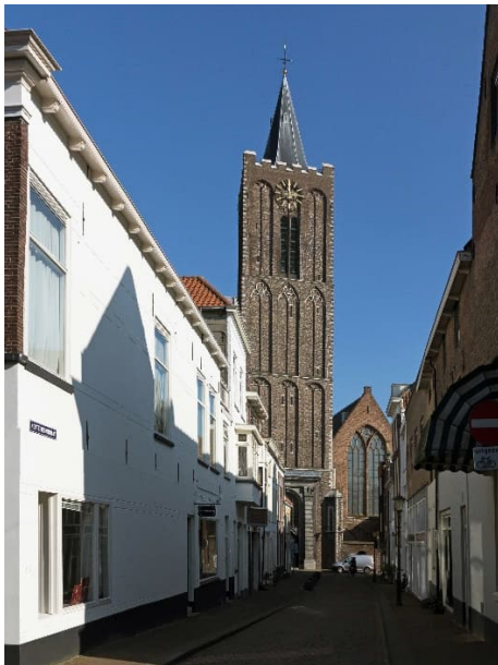
Schiedam Sint Jans-kerk