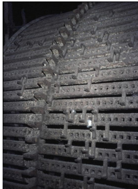
De speeltrommel in Brielle

Een tweede reeks bezoeken van Berghuys aan Brielle, in 1788 en volgende jaren, betrof opnieuw problemen met het speelwerk en het uurwerk. Ook nu kwam Berghuys de stand van zaken opnemen en een advies uitbrengen. Dit keer was zijn conclusie dat de problemen verband hielden met de 'nongellence' van collega Hugo Captein. In 1790 ten slotte schrijft Berghuys dat hij in het voorjaar van 1791 nog eens zal komen kijken. Dat bezoek, als het al heeft plaatsgevonden, is niet meer gedocumenteerd.